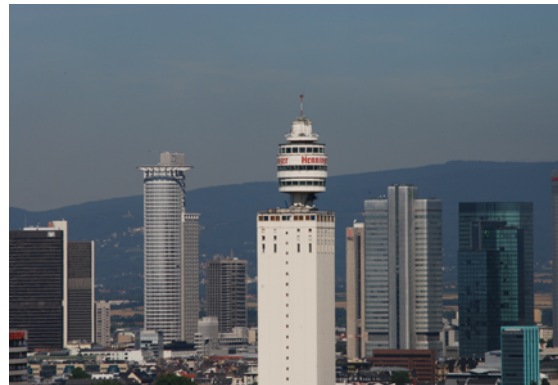
Brennweite: 300 mm (kleinbildäquivalent)