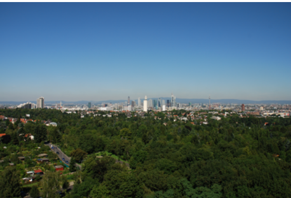
Brennweite: 28 mm (kleinbildäquivalent)