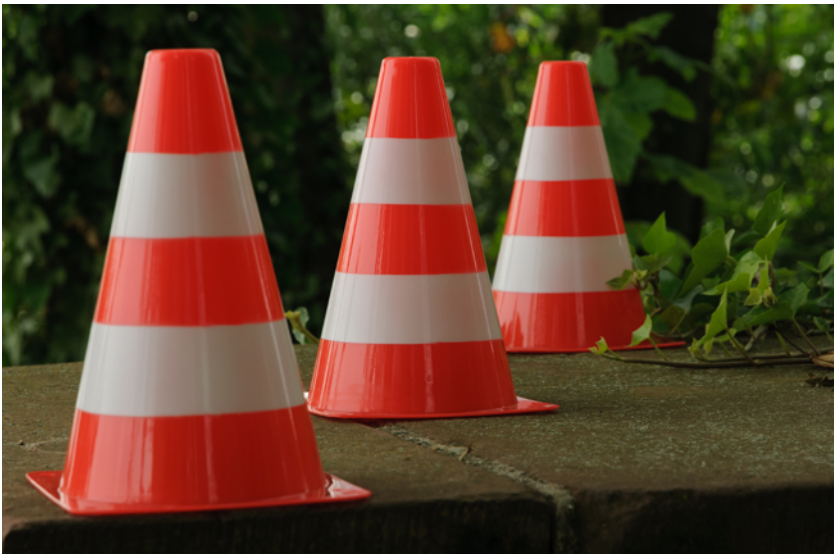
Mit längerer Brennweite und mehr Abstand fotografiert 125 mm, A/Av-Modus, Blende 11, 1/160 s, ISO 400