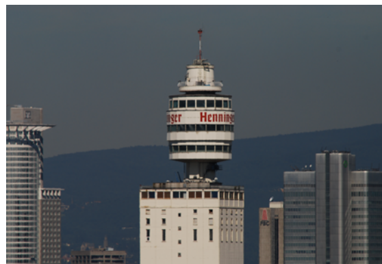
Brennweite: 600 mm (kleinbildäquivalent)