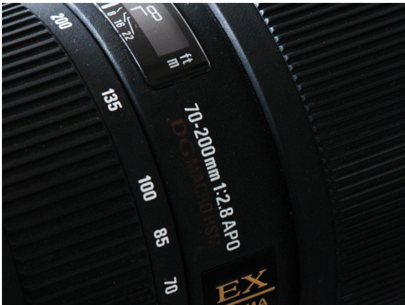
Zoomring bei einem Sigma-Objektiv 125 mm, A/Av-Modus, Blende 8, 1/50 s, ISO 1600, -1,3 EV

Wer nun vermutet, es sei egal, ob man zoomt, also die Brennweite verändert, d. h., näher an das Motiv herangeht oder sich weiter davon entfernt, liegt falsch! Daher finden Sie später auch noch eine Übung zum Umgang mit Brennweite und Abstand und wichtige Tipps zur Gestaltung von guten Fotos. Zum besseren Verständnis geht es zuerst aber um die Brennweite als solche und was der Begriff eigentlich bedeutet.