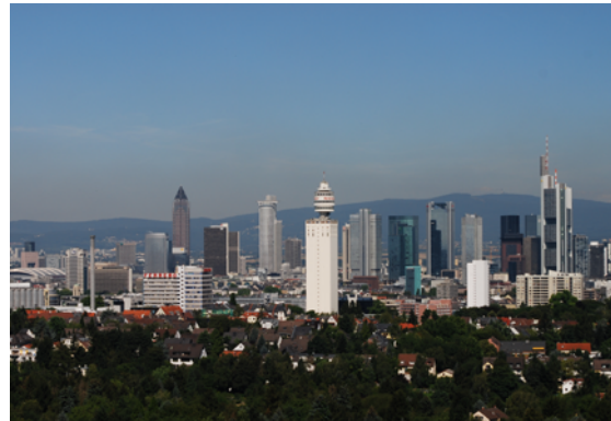
Brennweite: 105 mm (kleinbildäquivalent)