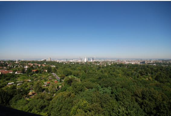
Brennweite: 15 mm (kleinbildäquivalent)