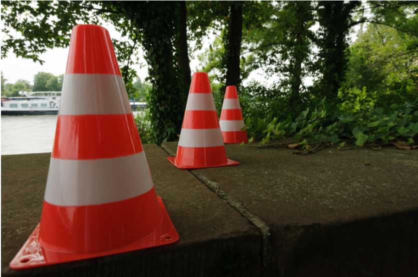
Mit kurzer Brennweite nah ans Motiv gegangen 24 mm, A/Av-Modus, Blende 11, 1/160 s, ISO 400